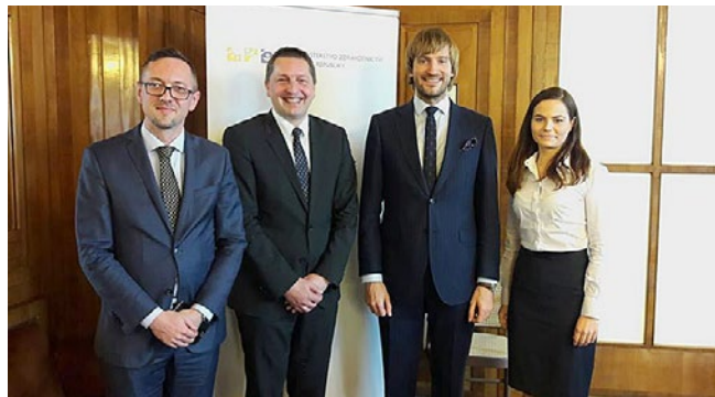
Z jednání na Ministerstvu zdravotnictví, březen 2018